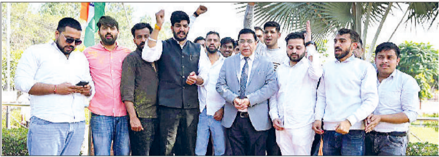
जीद। सीआरएसयू में वीसी के साथ मौजूद एबीवीपी पदाधिकारी।