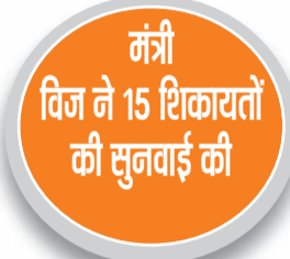
मंत्री विज ने 15 शिकायतों की सुनवाई की