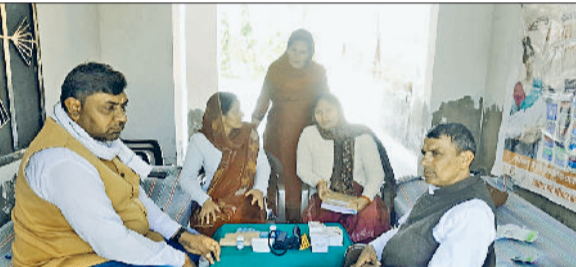
राजौड़। स्वास्थ्य जांच शिविर के दौरान मौजूद स्टाफ सदस्य व अन्य।