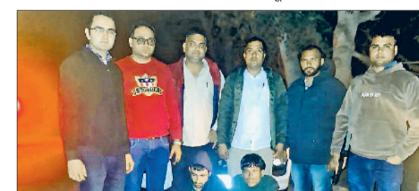
जौड़। पुलिस गिरफ्तार में आरोपित।