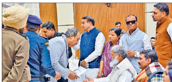
कैथल। लोगों की समस्या सुनते मंत्री अनिल विज।

आरकेएसडी कॉलेज के सभागार में जिला कष्ट निवारण समिति की बैठक में हरियाणा के परिवहन, ऊर्जा एवं श्रम मंत्री अनिल विज ने 15 शिकायतों की सुनवाई की। जिसमें नौ पुरानी व 6 नई शिकायतें शामिल रही। बैठक में मंत्री अनिल विज सख्त नजर आए। उन्होंने जमीन संबंधी एक मामले की सुनवाई में आरोपी पुलिस कर्मचारी को सस्पेंड करने के आदेश जारी किए। साथ ही ट्रांसफार्मर स्थानांतरित करने के मामले में रिश्तत मांगने की शिकायत में जेई के खिलाफ एफआईआर करने के आदेश भी जारी किए। उन्होंने राजौद नगर पालिका में पिछले साढ़े तीन साल में हुए कार्यों में वित्तीय अनियमितताओं की शिकायत की जांच विजिलेंस से भी करवाने के आदेश जारी किए। उन्होंने गांव पाई