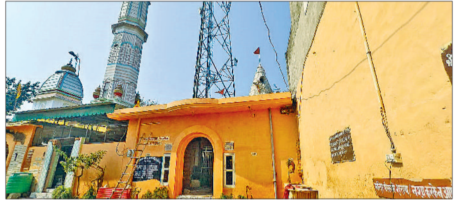
राजौड़। दुर्गा मंदिर में सजाते हुए।