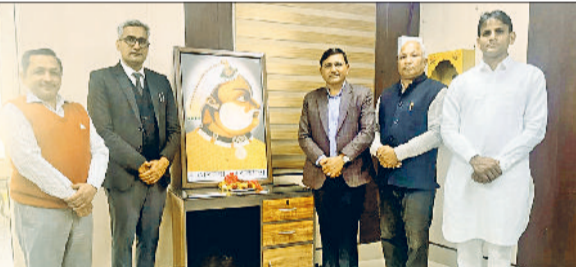
महाराजा सूरजमल के जन्मोत्सव पर श्रद्धा सुमन अर्पित करते जाट संस्था के पदाधिकारी।